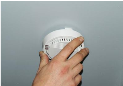
Kuva 2: Havainnekuva palovaroittimesta